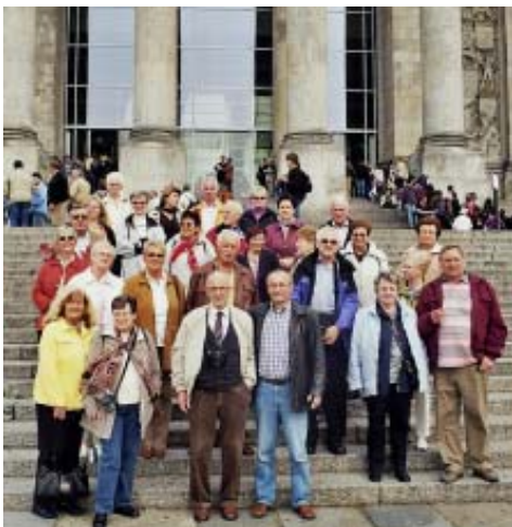
Gruppenbild vor dem Reichstag

Zum ersten Mal hatten wir "auf eigene Faust" eine viertägige Flugreise nach Berlin angeboten. 30 konnten mitfliegen. Es wurde zum Erlebnis, das so schnell nicht vergessen wird. An einem Tag ging's nach Potsdam, wo es von restaurierten Schlössern nur so wimmelt. Schließlich war Potsdam einmal der Sitz der deutschen Könige und Kaiser. Geschichte pur, die die einen mit dem Fahrrad und die anderen zu Fuß erleben durften. Nun laden wir zum Nachtreffen ein, auf dem unzählige Bilder gezeigt werden. Es findet statt am