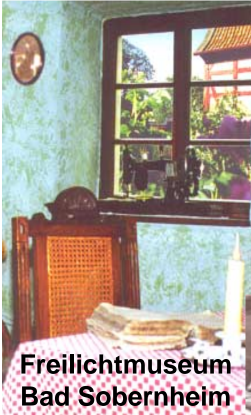
Freilichtmuseum Bad Sobernheim

Bei vollem Bus (50 Pers.) ist der Eintritt im Freilichtmuseum frei. Der Eintritt kostet wie beim Kupferbergwerk und den Edelsteinminen 3 EUR, die Weiherschleife 2,50 EUR.