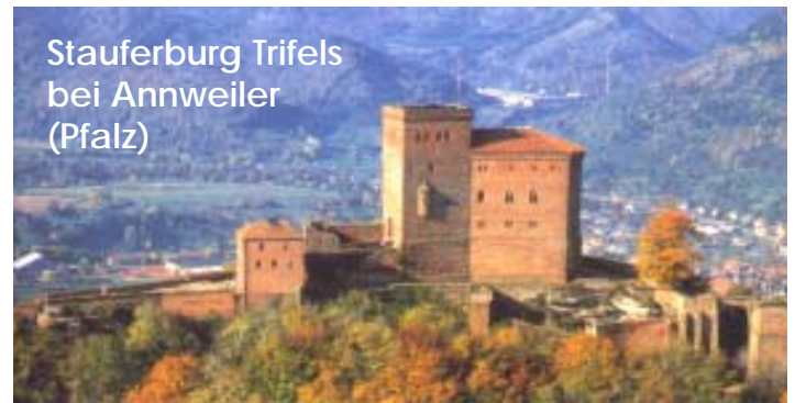
Stauerburg Trifels bei Annweiler (Pfalz)

Beim anschließenden Fischessen in Silz waren wir unter uns - kein Fest, das sollte erst später kommen. Aber zunächst gings nach Wissembourg, dessen Verkaufsmeile an diesem Tag von Deutschen nur so heimgesucht wurde. Schließlich war in Frankreich Werktag. Aber in den schönen Nebengässchen waren wir wieder unter uns und konnten zwischendurch lothringisch essen und Karlsberg-Bier trinken.