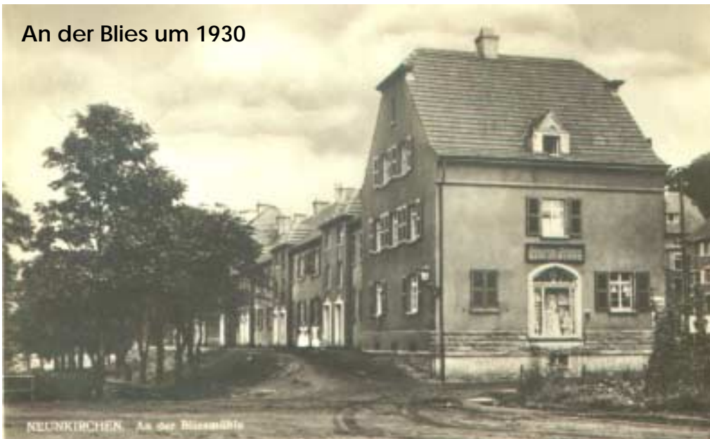
An der Blies um 1930

Wer weiß auch noch, dass Kinder bei Durchfall in der Drogerie ein probates Mittel kaufen konnten? Dro-