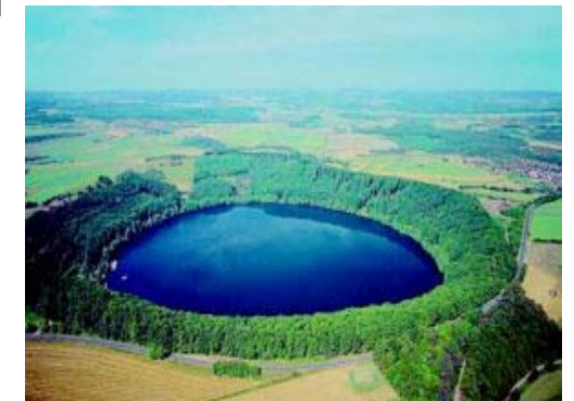
Bild: Das Pulvermaar bei Gillenfeld ist mit 36 Hektar der größte Maarsee der Eifel und mit 71 Metern Wassertiefe der tiefste Binnensee Deutschlands außerhalb der Alpen

Entstanden sind die Maare der Eifel vorwiegend durch Gaseruptionen. Entgegen älteren Theorien sind die Maare nicht durch Explosionen entzündlicher Gase aus dem Erdinnern entstanden. Heute gehen Wissenschaftler davon aus, dass äußerst heftige Wasserdampfexplosionen die Maarkessel ausgesprengt haben. Wenn versickerndes Oberflächenwasser oder auch Grundwasser mit dem durch Fugen und Klüfte nach oben steigenden, weit über