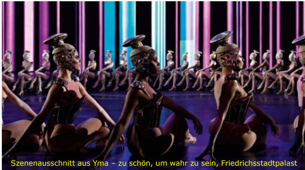
Szenenausschnitt aus Yma – zu schön, um wahr zu sein, Friedrichsstadtpalast

gegeben hat, entstehen gewaltige Bühnenbilder, die so noch nicht auf einer Bühne zu sehen waren. Yma (gesprochen: Ima) ist eine Achterbahnfahrt der Sinne durch ein höchst ungewöhnliches und bezauberndes Leben: das Leben der fikti-