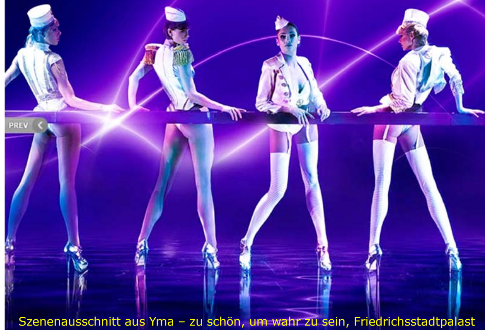
Szenenausschnitt aus Yma – zu schön, um wahr zu sein, Friedrichstadtpalast