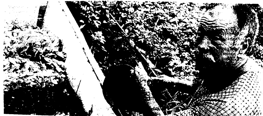
Foto: Nordpol-Vorsitzender Armin Tilian an seinem Salatbeet in der Gartenanlage Nordpol