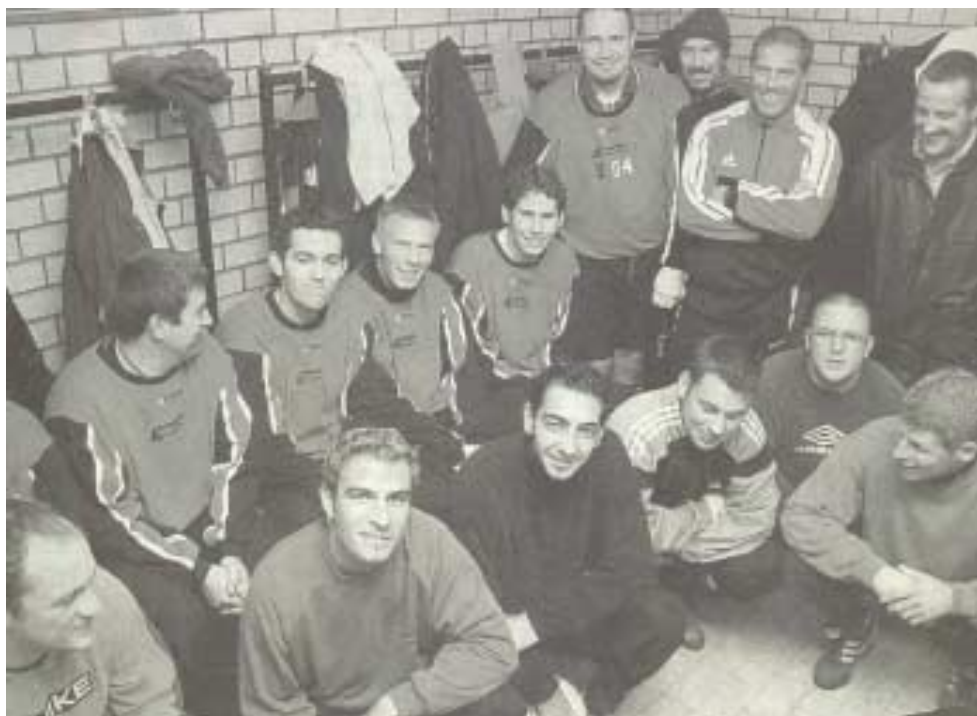
Der Verein der Unbezwingbaren: FVN Neunkirchen

Das ist absolute Spitze: Insgesamt 368 Mannschaften spielen im Saarländischen Fußballverband um den Aufstieg. Keine ist wie der FVN nach 14 Spielen ungeschlagen.