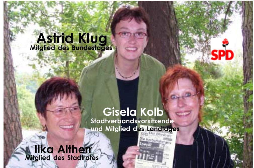
Astrid Klug Mitglied des Bundestages